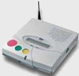
4 Järjestelmä kansliayksikkö sijoitetaan kansliaan tai toimistoon.

Anna asukkaalle mahdollisuus liikkua joustavasti ja monipuolisesti!