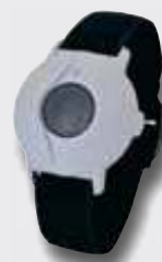
1 Asukkaan perus langaton kutsuranneke, jota asukas kantaa ranteessaan. Kutsu voidaan tehdä alueella, jossa kantama riittää tukiasemiin.

Rannenuhan sijasta siihen voidaan valita mm. vyöclipsi tai kaulanauha.