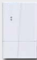
2 Lisärelekyksikkö voidaan sijoittaa mihin vain, josta halutaan ulkopuolisia lisähälytyksiä. Yksikköön voidaan ohjelmoida jopa 500kpl erilaisia lähettämiä!

Tarvittessa yksikköön voidaan liittää myös huonemerkkilamput.