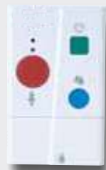
1 Huonepaneeli sijoitetaan asukashuoneeseen, johon liitetään mm. johtokutsupainike. Sillä voidaan tehdä kutsuja, hätäkutsuja sekä hoitajan läsnäolo.

Tarvittessa yksikköön voidaan liittää myös huonemerkkilamput.