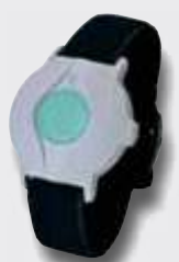
1 Kutsuranneke toimii myös hyvin ulkoalueilla ja on luokitukseltaan täysin vesitiivis.

Rannenuhan sijasta siihen voidaan valita mm. vyöclipsi tai kaulanauha.